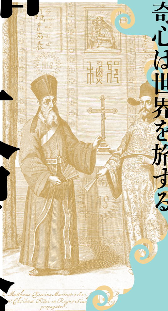
Matthaeus Riccius Macerat. Soc. Jesu. Propagator. Christianae Fidei in Regno Sinae