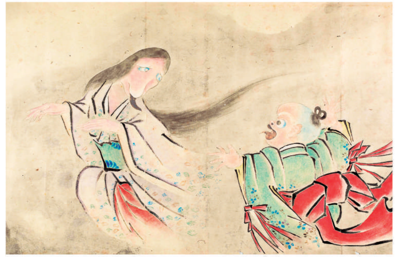
「化物絵巻」(部分) 京都府立京都学・歴史館蔵