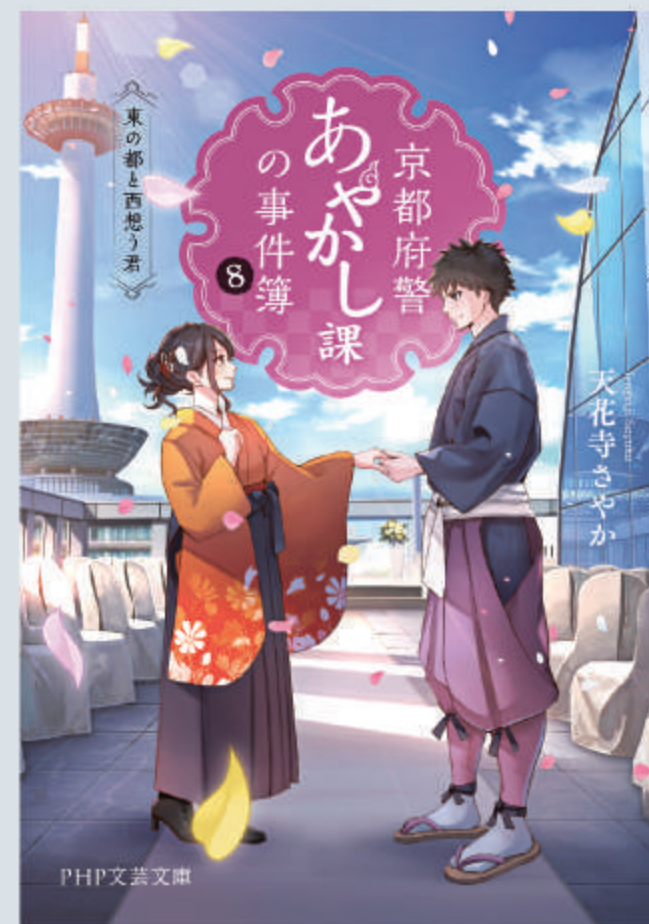
装丁：小川恵子(瀬戸内デザイン) 装画：ショウイチ/PHP文芸文庫