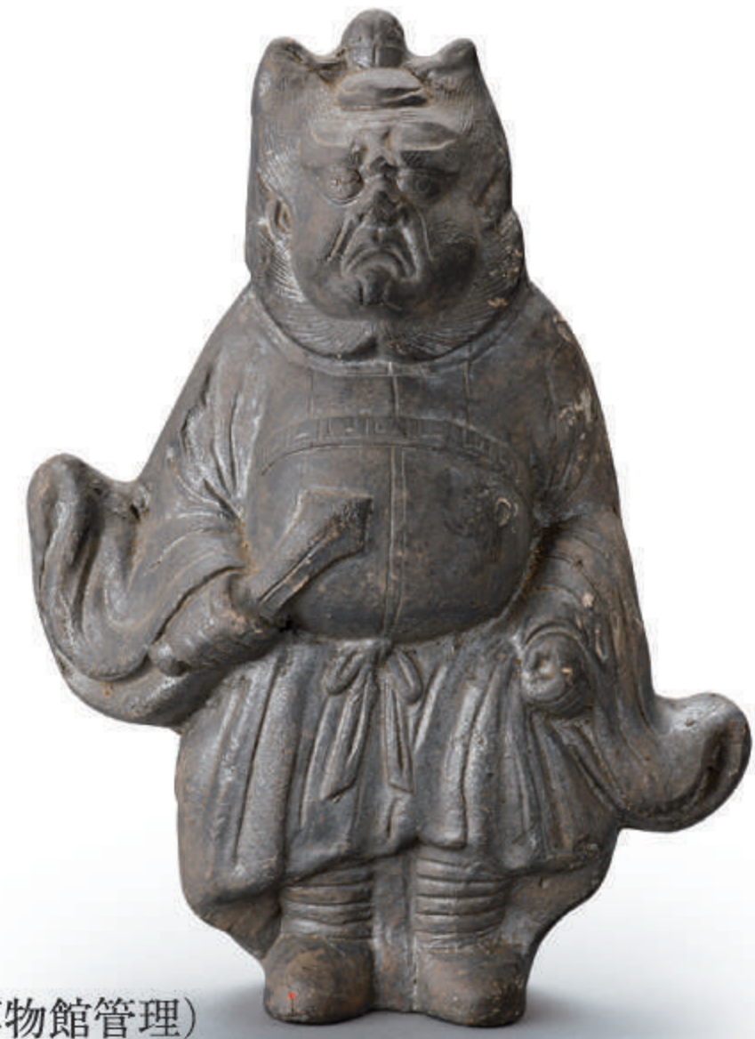
鍾馗像 京都府蔵 (京都文化博物館管理)