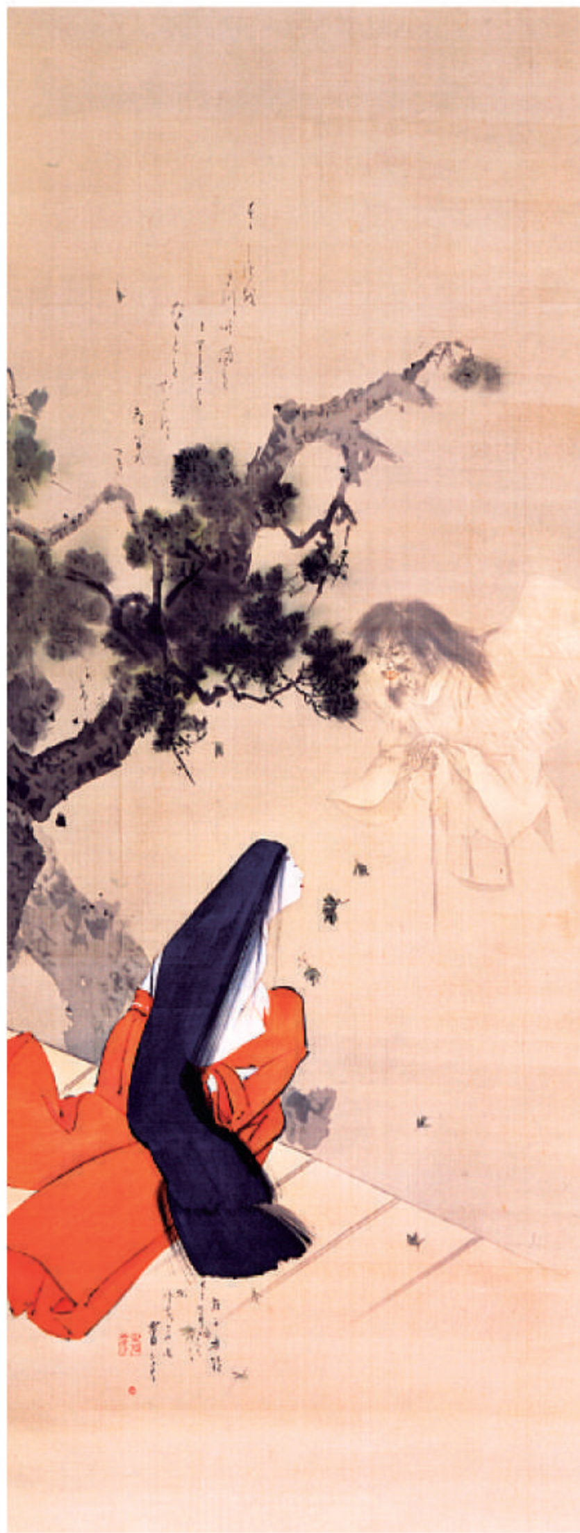
渡辺省亭「伊賀局」 京都府蔵(京都文化博物館管理)

我々の世界のすぐ隣には別の世界があり、そこにはこの世ならぬモノ達が棲んでいる。病気や災害などの災厄は、そうした世界の住人からの干渉が生み出す現象なのではないか？人びとは身の回りに起こる不可思議な現象を異界との邂逅として解釈してきました。そして異界から何か悪いモノがやってくるようにと様々な呪法が編み出され、魔よけやまじないが修されてきたのです。この展覧会では、人びとが異界に向けてきたまなざしに着目し、それがどのように表現されてきたのか、そして異界からの侵蝕に対して、人びとはどのように対処してきたのかについて、関連資料の展示等によって紹介します。