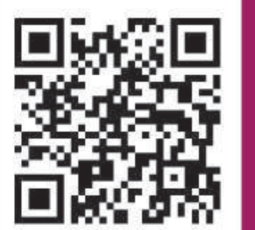
イベント申込フォーム

※先着順。定員に達し次第、受付を終了します。 ※参加者1名ごとにお申込みください。