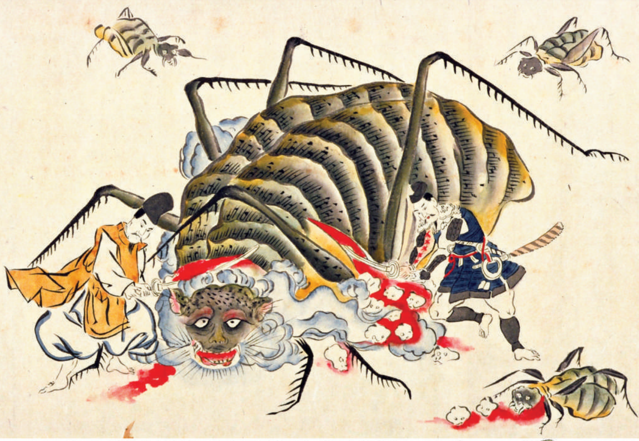
「土蜘蛛之草紙」(部分) 京都府立京都学・歴史館蔵