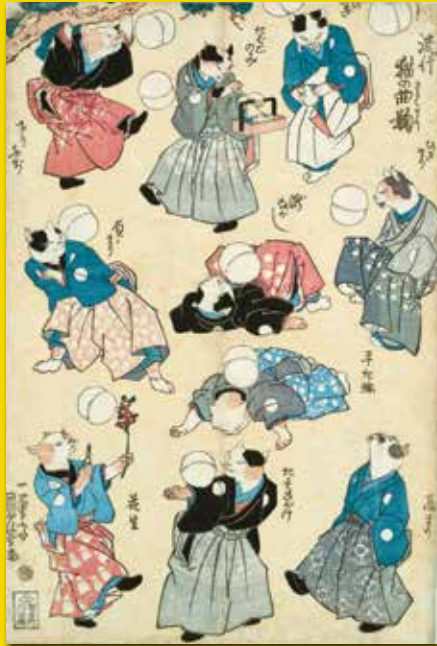
主はお仕事、ハアハア眺めだねえ