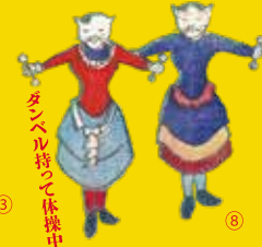
「たいそうなナマズだねえ。うまそうだ」