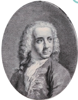
《カナレットとヴィゼンティーニの肖像》(部分) 1735年 個人蔵

カナレットは今から300年前、ヴェネツィア(今のイタリア北東部にある都市)で活躍した画家だよ。彼は生まれ育ったヴェネツィアの街をたくさん描いたよ。