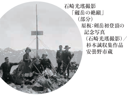
石崎光瑠撮影「剣岳の絶頂」(部分) 原板：剣岳初登頂の記念写真(石崎光瑠撮影) / 杉本誠収集作品 安曇野市蔵