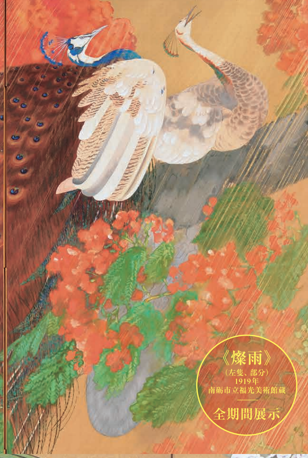
《燦雨》 （左隻、部分） 1919年 南砺市立福光美術館蔵 全期間展示

【開室時間】10時～18時（金曜日は19時30分まで）※入場は開室30分前まで 【休館日】月曜日（祝日の場合は開館、翌日休館） 【主催】京都府、京都文化博物館、毎日新聞社、京都新聞 【後援】公益社団法人京都府観光連盟、公益社団法人京都市観光協会、KBS、京都エフエム京都 記載内容に変更が生じる場合があります。最新の情報は当館HPをご覧ください。