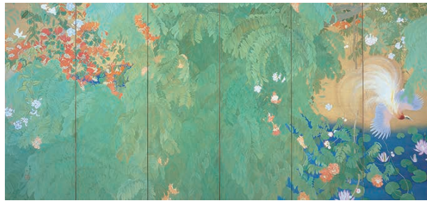
《熱国妍春》1918年 京都国立近代美術館蔵【展示期間：9/14〜10/14】

石崎光瑠（二八八四〜一九四七）は、鮮やかな色彩で華麗な花鳥画を数多く残した近代京都の日本画家です。富山に生まれた光瑠は、十九歳で京都に出、竹内栖鳳に入門。一九一六年から翌年にかけてインドを旅し、帰国後、その成果として『熱国妍春』、『燦雨』を描いて文展・帝展で二年連続の特選を受け、注目を集めました。本展は、光瑠の故郷にある南砺市立福光美術館（富山県）のコレクションを中心に、光瑠の画業の全貌を紹介します。 全国初!! 大規模回顧展