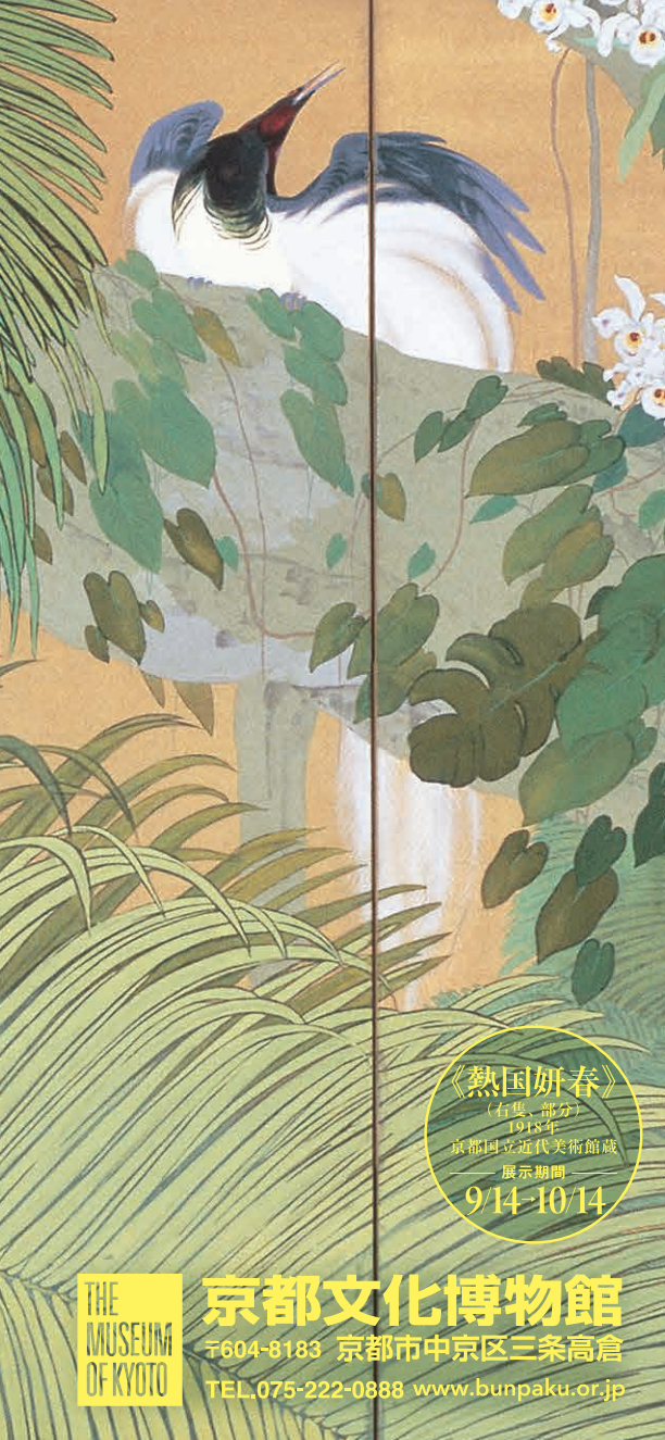
《熱国妍春》 （右隻、部分） 1918年 京都国立近代美術館蔵 展示期間 9/14-10/14