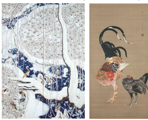
左:《雪》(右隻) 1920年 南砺市立福光美術館蔵 右:《鶏之図(若冲の模写)》(右幅) 1926年 富山市郷土博物館蔵【展示期間：10/16〜11/10】