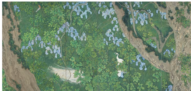
《白孔雀》1922年 大阪中之島美術館蔵【展示期間：10/1〜11/10】