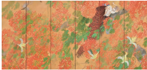
《燦雨》1919年 南砺市立福光美術館蔵