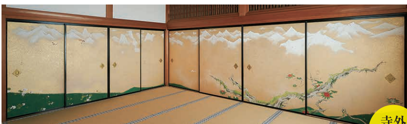
金剛峯寺奥殿(雪嶺の間) ※襖絵は石崎光瑠《雪嶺》1935年