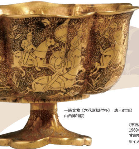
一級文物《六花形脚付杯》 唐・8世紀 山西博物院