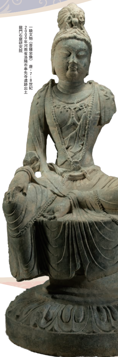
一級文物《菩薩坐像》 唐・7-8世紀 2000年河南省洛陽市奉先寺遺跡出土 龍門石窟研究院