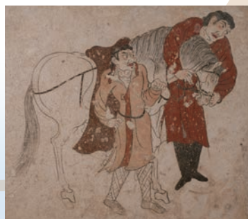
一級文物《獻馬圖》 唐・乾封元年(666) 1991年陝西省禮泉唐李静公墓出土 昭陵博物館