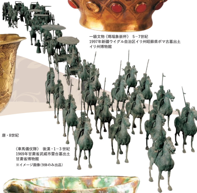
《車馬儀仗隊》 後漢・1-3世紀 1969年甘肅省武威市雷台墓出土 甘肅省博物館 ※イメージ画像(9体のみ出品)