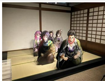
柱稽古編のキービジュアルに入れるフォトスポット