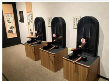
刀鍛冶の体験ゲーム